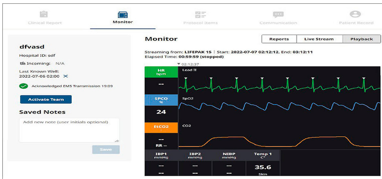
Rycina 2. Podgląd EKG i parametrów pacjenta na platformie streamingowej